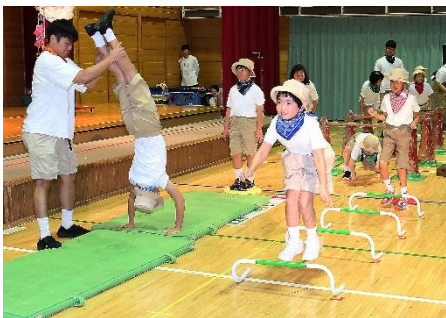
小学部「あおばやま探検隊」

10月5日(土)、「みんなでハッピー！みんなでスマイル！！」をテーマに、本校体育館で学習発表会が行われました。日々、取り組んでいる音楽の合奏や保健体育でのサーキット運動、校外学習で見学や体験から学んだ科学の知識やSDGsの視点等を、音楽発表や劇を通して表現しました。初めての試みであったグランドフィナーレでは、全校児童生徒が一つとなって合奏やダンスを披露しました。当日は、卒業生も来校し、「みんな、すてきだった。感動した」と話していました。ご家族の皆様からも学部を超えて、温かい拍手やお褒めの言葉をいただき、ありがとうございました。