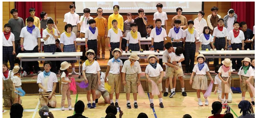
グランドフィナーレ「ふとくのツバメっ子」