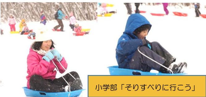
小学部「そりすべりに行こう」

また、1月26日、小学部は、ダイナミックな雪遊びを体験することをねらいとし、泉ヶ岳でのそりすべりを楽しみました。当日は十分な積雪と快晴に恵まれ、絶好のそりすべり日和となりました。どの児童も寒さや滑るスピードに臆することなく、そり滑りの爽快感を味わったり雪遊びの楽しさを満喫したりしました。帰校した際の、笑顔や疲れた表情等の様子から、遊びきった充足感があふれていました。