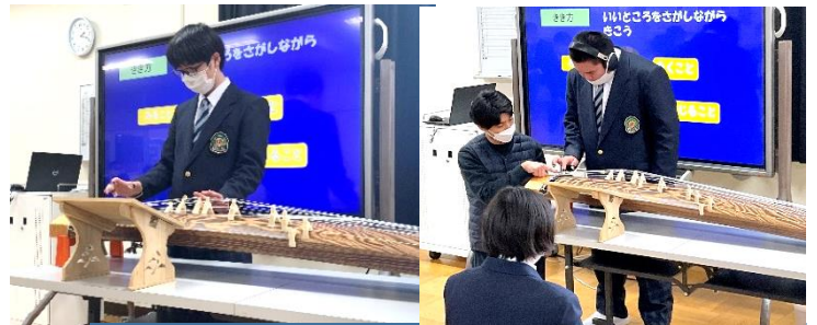
高等部「和楽器に親しもう」

1月は、正月や雪といった、日本の伝統に触れたり季節を感じたりする活動を楽しめる時期です。学校生活においても、全学部の音楽の授業で、和楽器の音色を感じ新春の雰囲気味わうことをねらいとし、和琴の演奏に取り組みました。教師の演奏を聞いて「テレビで聞いたことがある」と話したり、実際に琴爪をつけてドキドキしながら鳴らした音の美しさに笑顔を見せたりし、日本古来の楽器の音色を味わいました。