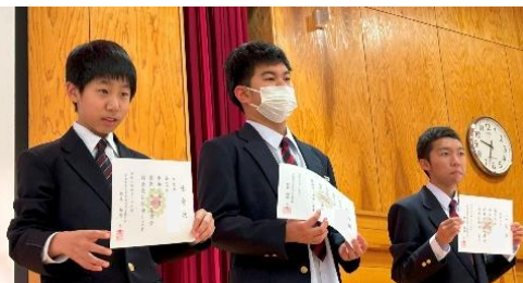
中学部生徒会役員