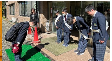
挨拶と笑顔の伝染～あいさつ運動～