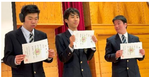
高等部生徒会役員