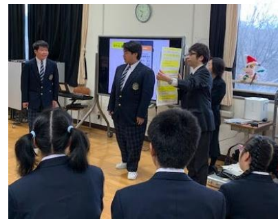
ロールプレイの様子 「変なメールがきた。どうしよう…」