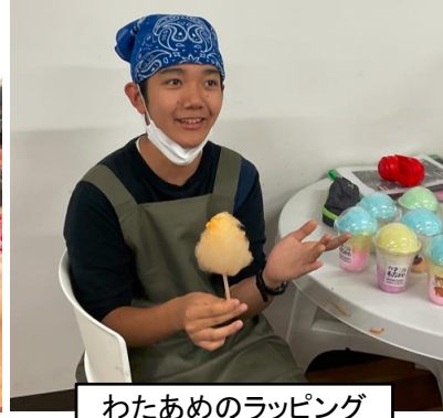
わたあめのラッピング