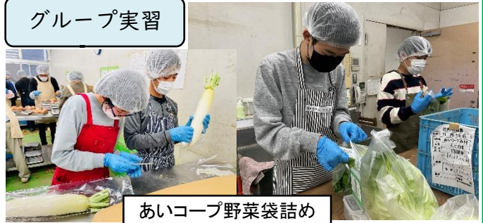
あいコープ野菜袋詰め