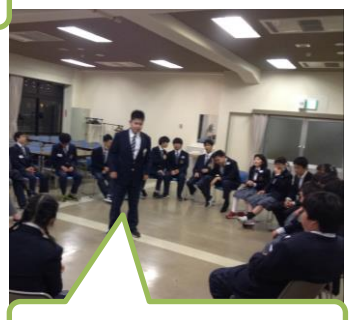
2つのゲームをしました