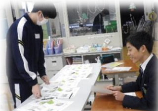
会社のロゴマーク集計