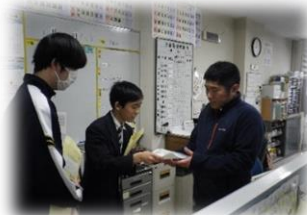
保護者宛文書の起案