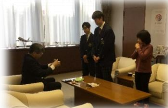
副知事を表敬訪問