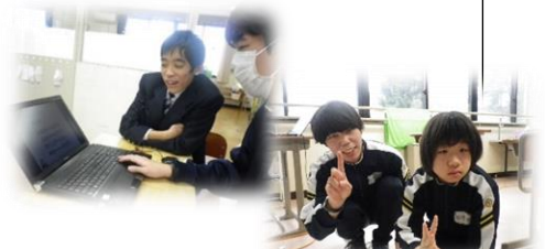
後援会発表準備，練習