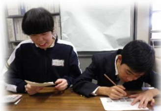
保護者あての文書作成