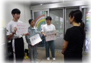
おもてなしランド提案