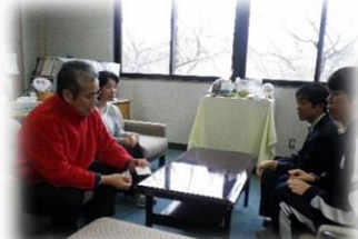
県庁での販売会を提案