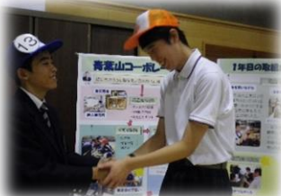
公開研究会で会社紹介